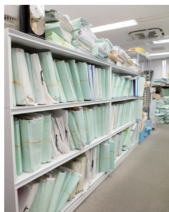
DX化によるデータ集約を目指す